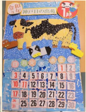
今年の干支 丑のちぎり絵・ カレンダー・折り紙 ♡