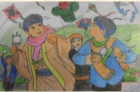
お正月の遊び 塗り絵 ♡ お上手！