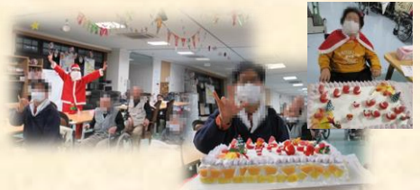
手作りケーキでクリスマス会 ☆